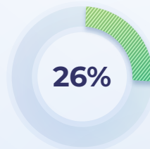
Tecnología e innovación