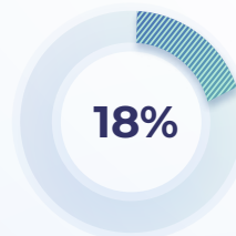
Usuarios y audiencias

Durante 2019 el Instituto participó en 16 eventos de política y regulación, 14 de tecnología e innovación, 14 de vinculación institucional y nueve de usuarios y audiencias.