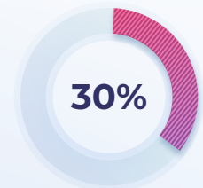
Eventos de regulación política