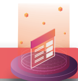
Tabla 6. Opiniones y resoluciones en materia de concentraciones y concesiones durante abril-junio 2019